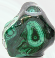
Gepolijste Malachiet uit Kongo