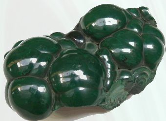
Ruwe Malachiet uit Kongo