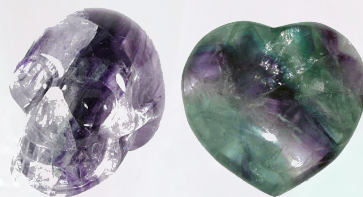
Fluoriet schedel en hart