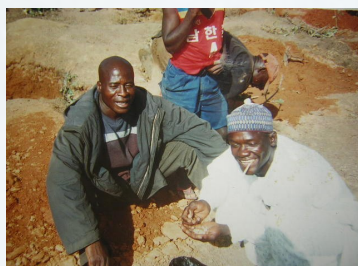
Topaas mijn in Nigeria