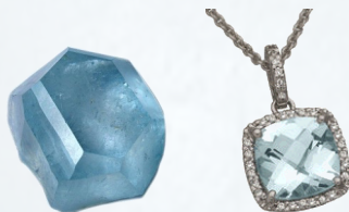
Blauw Topaas kristal en hanger