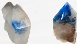
Punten van Papagoiet