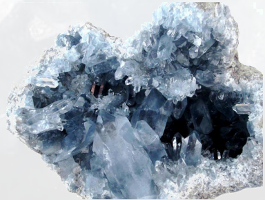
Ruwe Coelestien kristallen