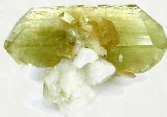
Ruwe Brazilianiet uit Brazilië