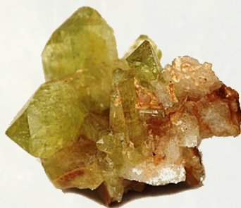
Ruwe Brazilianiet uit de U.S.A.